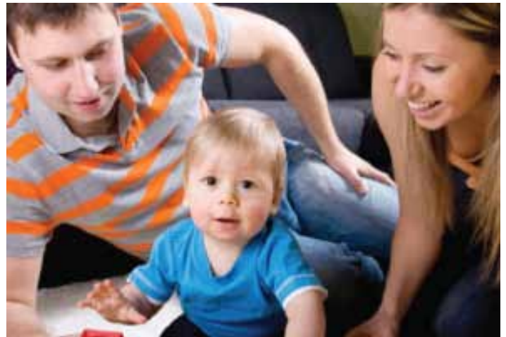
ปกป้องและดูแลคนที่คุณรักตลอดเวลาด้วยผลิตภัณฑ์คุณภาพสูงจาก Honeywell