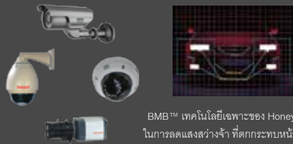
BMB™ เทคโนโลยีเฉพาะของ Honeywell ในการลดแสงสว่างจ้า ที่ตกกระทบหน้ากล้อง

ผลิตภัณฑ์ CCTV ในกลุ่ม Black Series ซึ่งประกอบด้วย