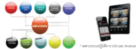
* รองรับระบบปฏิบัติการ iOS และ Android

ในส่วนของคุณสมบัติที่จะมารองรับการทำงานของคุณสมบัติของอุปกรณ์บันทึกภาพ กล้องวงจรปิด / IP Camera ในการแสดงและบันทึกภาพ หรือแม้กระทั่งการเรียกดูภาพผ่านมือถือ Hikvision ได้ให้การสนับสนุนซอฟต์แวร์เหล่านี้ เพื่อช่วยในการลดค่าใช้จ่าย ในส่วนของซอฟต์แวร์ สำหรับจุดเด่นของซอฟต์แวร์ของ Hikvision นั้น สามารถทำการรวมระบบกล้องวงจรปิดไว้บนซอฟต์แวร์ตัวเดียว ไม่ว่าจะระบบอนาล็อก หรือ IP Camera ที่มีชื่อเรียกว่าซอฟต์แวร์ iVMS4000 หรือ iVMS4200 ซึ่งซอฟต์แวร์ตัวนี้สามารถรองรับการทำงานของคุณสมบัติของอุปกรณ์บันทึกภาพ และกล้อง IP Camera ได้สูงสุด 250 อุปกรณ์ หรือ 250 ไอพีแอดเดรส สำหรับซอฟต์แวร์อีกตัวที่อยากแนะนำก็คือ iVMS4500 เป็นซอฟต์แวร์สำหรับวิธีเรียกดูภาพผ่านทางโทรศัพท์มือถือ สนับสนุนระบบปฏิบัติการ iOS, Android, Windows Mobile และ Symbian (JAVA) สามารถดาวน์โหลดติดตั้งเองได้ มีคุณสมบัติรองรับการทำงานเรียกดูภาพจากอุปกรณ์บันทึกภาพ และกล้อง IP Camera ได้สูงสุด 32 อุปกรณ์ สามารถดึงภาพจากอุปกรณ์บันทึกภาพ และกล้อง IP Camera เข้ามาดูจากที่ไหนก็ได้ ทำให้สะดวกในการใช้งาน