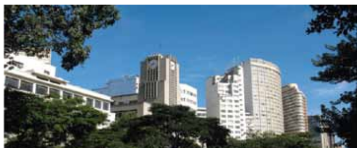
Hikvision Protect Brazil for World Cup ติดตั้งระบบกล้องวงจรปิดในการเฝ้าระวังรักษาความปลอดภัยในฟุตบอลโลกปี 2014 ประเทศบราซิล