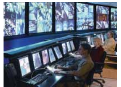
Honeywell Black Series ตอบสนองทุก Solution การใช้งานตั้งแต่ขนาดเล็ก-ขนาดใหญ่