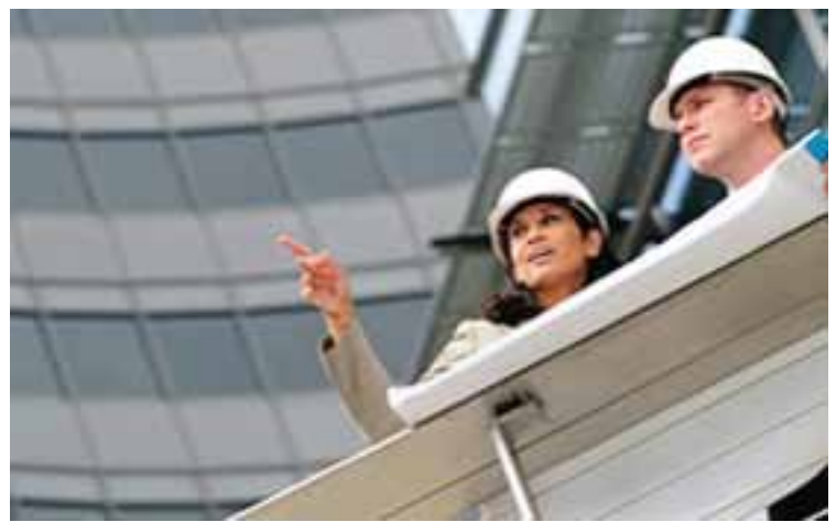
บุคลากรระดับหัวกะทิในด้านต่างๆ ของ Honeywell

Honeywell เป็นองค์กรขนาดใหญ่ระดับโลก ที่มุ่งมั่นไปที่การพัฒนาเทคโนโลยีเพื่อตอบสนองความต้องการของลูกค้าโดยผลิตภัณฑ์ที่ผลิตออกมาจะต้องเป็นผลิตภัณฑ์ที่ดีที่สุดสำหรับลูกค้าเท่านั้นทั้งหมดนี้เพื่อช่วยเหลือทางด้านการขายและการบริการหลังการขายให้แก่ตัวแทนจำหน่ายและผู้ออกแบบและติดตั้งระบบงาน โดยยึดคำมั่นสัญญาว่า “พวกเรากำลังสร้างโลกที่มีความปลอดภัยมากกว่าเดิม ด้วยนวัตกรรมการผลิตที่ดีที่สุด” ด้วยความต้องการเป็นผู้นำอย่างต่อเนื่องในด้านการผลิตอุปกรณ์รักษาความปลอดภัยของโลก Honeywell ได้ใช้งบประมาณถึง 70 ล้านเหรียญสหรัฐต่อปีในการวิจัยและพัฒนาผลิตภัณฑ์ซึ่งทำให้ผลิตภัณฑ์ของ Honeywell มีความโดดเด่นทางด้านเทคโนโลยีที่ทันสมัยและมีความน่าเชื่อถืออยู่เสมอโดยการใช้อุปกรณ์และเครื่องมือการผลิตที่ทันสมัยเพื่อผลิตผลิตภัณฑ์ที่ดีที่สุดผลิตภัณฑ์หลัก ประกอบด้วย