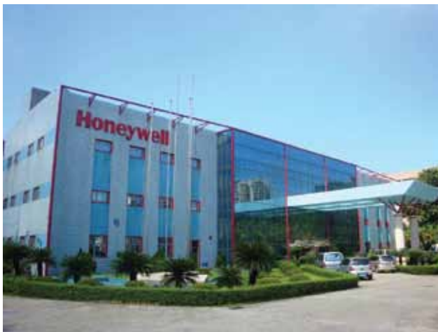
โรงงานผลิตสินค้าและสำนักงานของ Honeywell ที่กระจายอยู่ทั่วโลก

ผลการสำรวจผู้ผลิตอุปกรณ์รักษาความปลอดภัย TOP 50 ของโลกจากวารสาร A&S Magazine