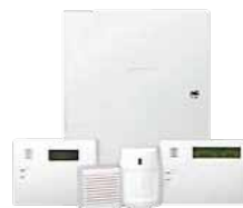
อุปกรณ์กันขโมย