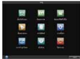
เมนูใช้งานภาษาไทย เข้าใจง่าย