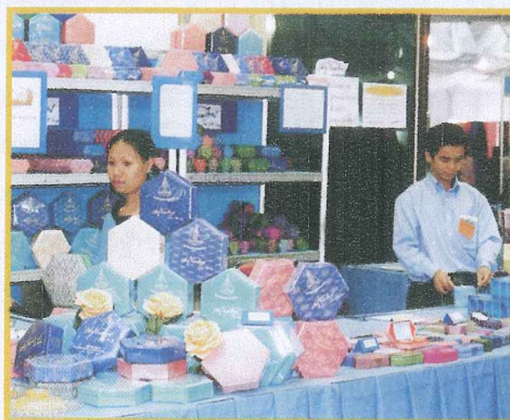
The first sale of the Thai silk soap at the Ambhorn Garden main hall.

These silk soap bars were available to the public for the first time at the "Fourth Arts of the Kingdom" exhibition and sold at the Ambhorn Garden in July, 2004. After the exhibition, the silk soap would be available at the SUPPORT Centre, Chitralada Shops Tel. 0-2281-1202 and big stores all over the country.